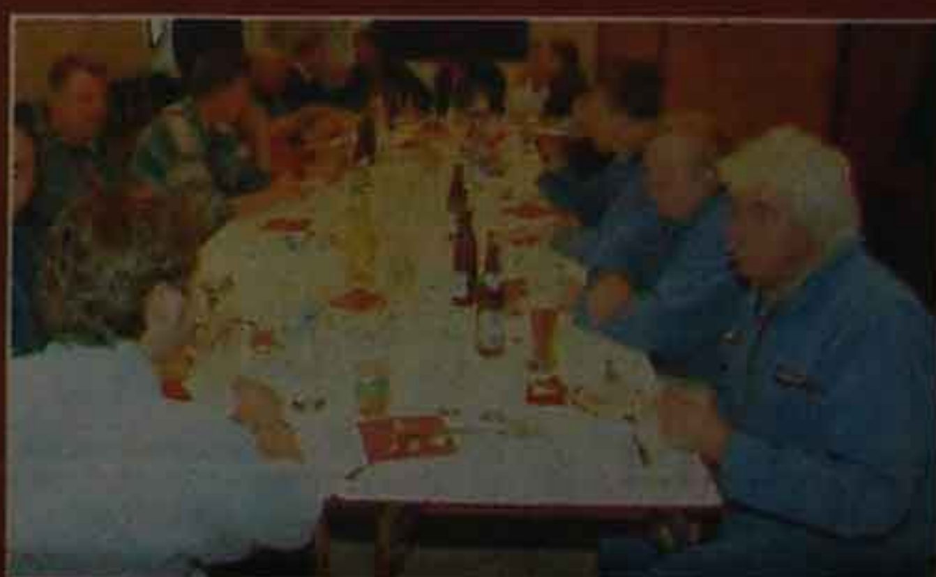
◀ 10.30 Uhr: Weißwurstfrühstück, um stark in den Tag zu gehen