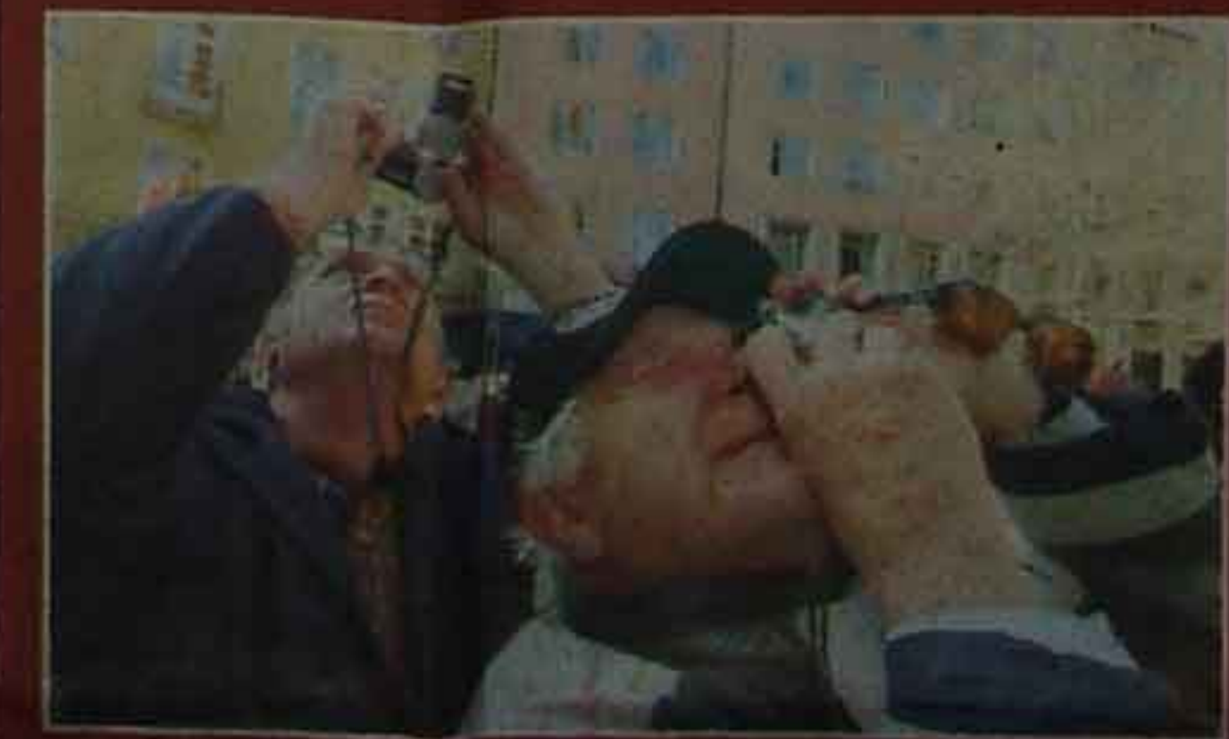
◀ Tausende Münchner beobachteten die Glocken auf dem Weg in den Südturm