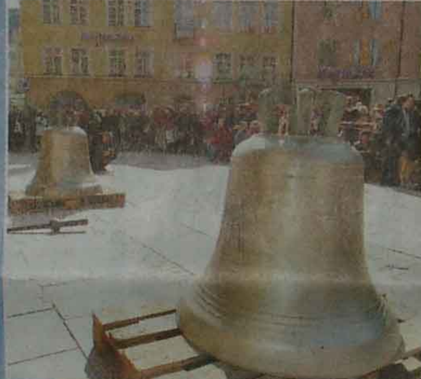
▲ 14 Uhr: Auf dem Frauenplatz sind die Glocken aufgestellt