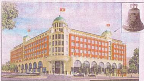
Das Störtebeker-Haus in Hamm-Süd mit seinem Glockenturm am Borstelmannsweg (rechte Gebäudehälfte) wird im August den Mietern übergeben.

TRADITION Abendblatt-Leser erlebten den Guss für das künftige Geschäftshaus in Hamm-Süd.